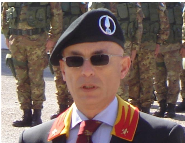
Il Consigliere Nazionale