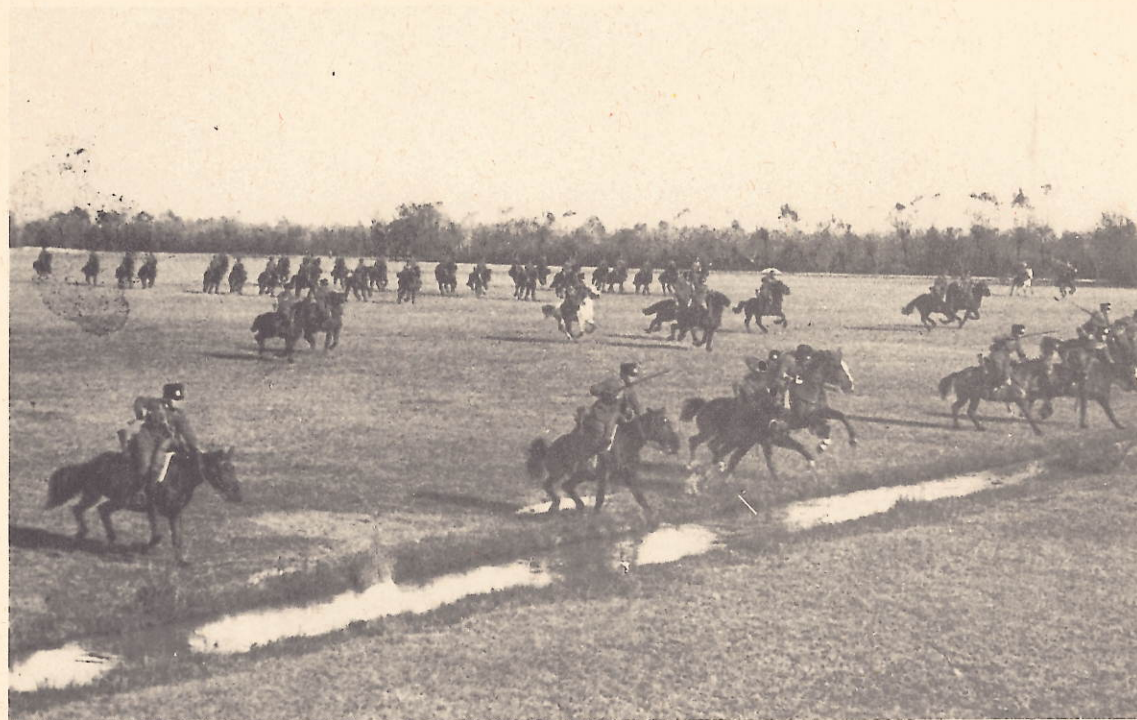
Vigonovo (Pn) - Luglio 1931 - Carica del 1° Sqd. nella Piana di Vigonovo durante il campo estivo