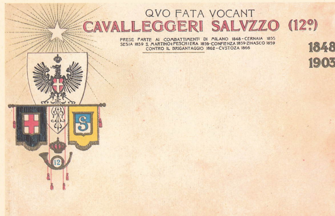
Da originale di cartolina reggimentale d'epoca