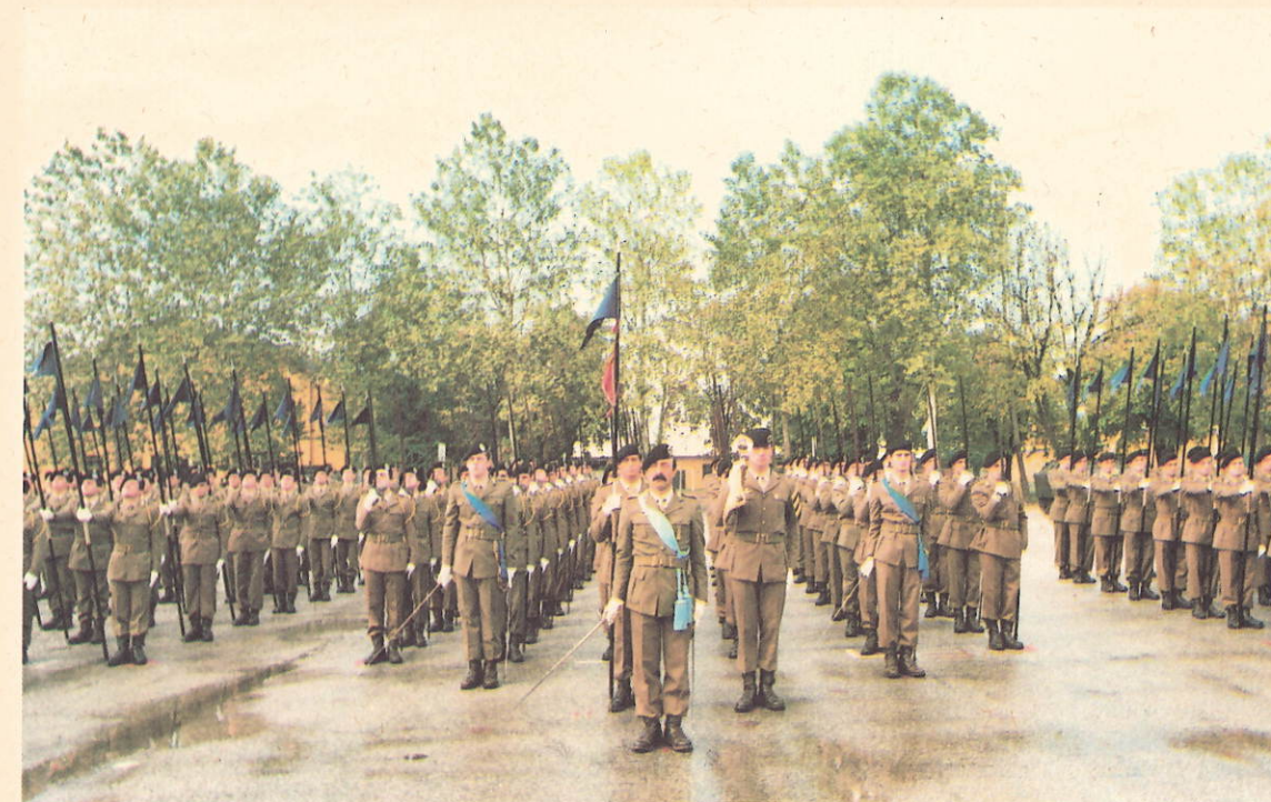
Festa di Corpo nello spirito delle tradizioni

Il 2 Novembre, anniversario della carica di Tauriano-Istrago, viene celebrata la Festa di Corpo.