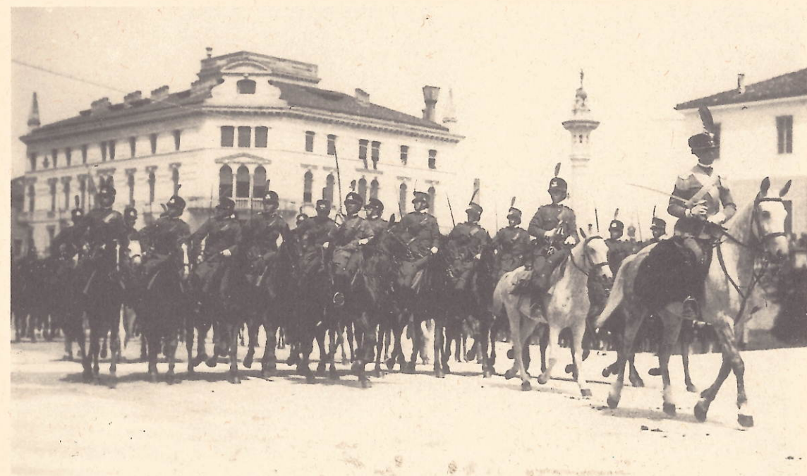
Pordenone - Prima domenica giugno 1931 - Festa dello Statuto