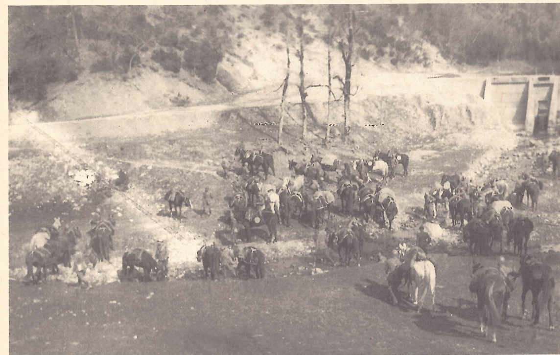
Sosta a Delnice - 14 aprile 1941