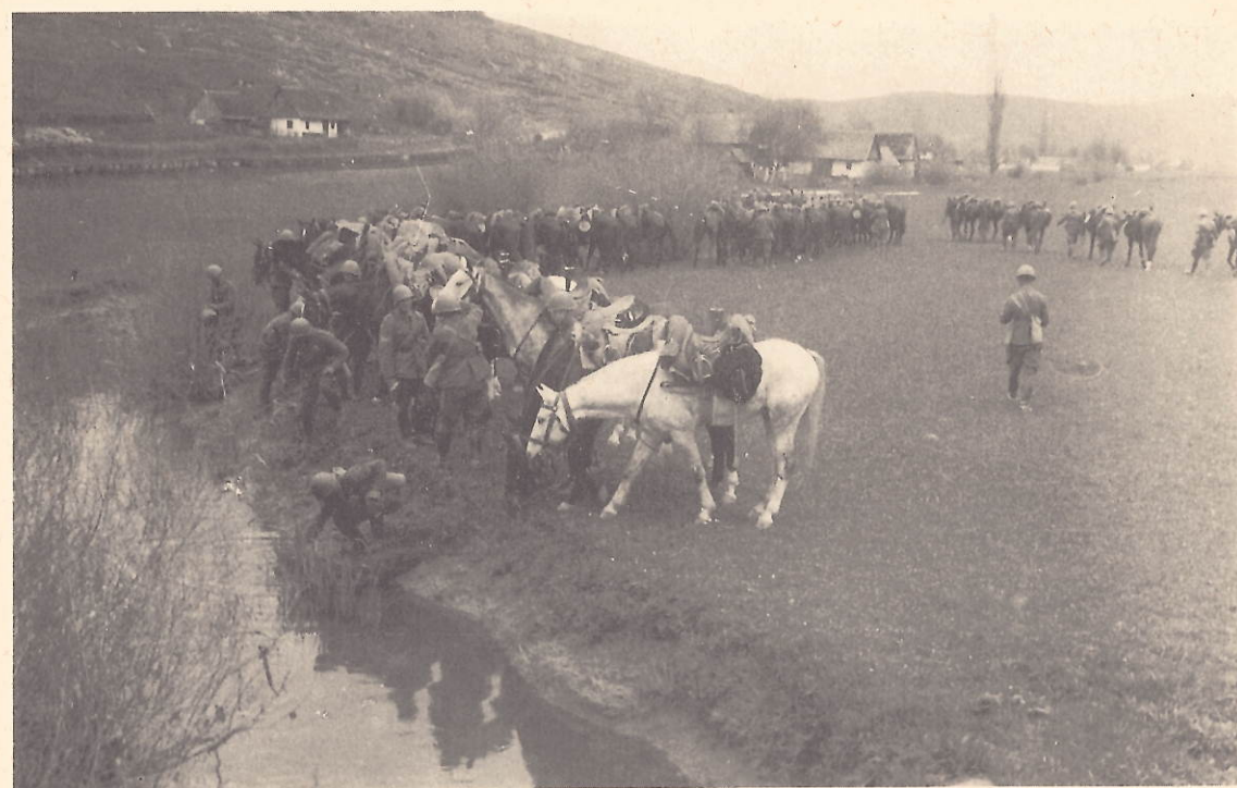
Cakovac - Abbeverata - 16 aprile 1941