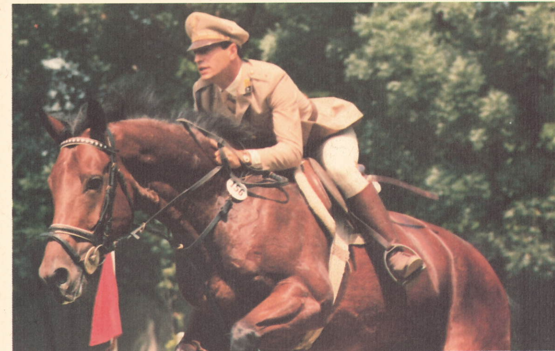
Attività ippica - Concorso nazionale 1985