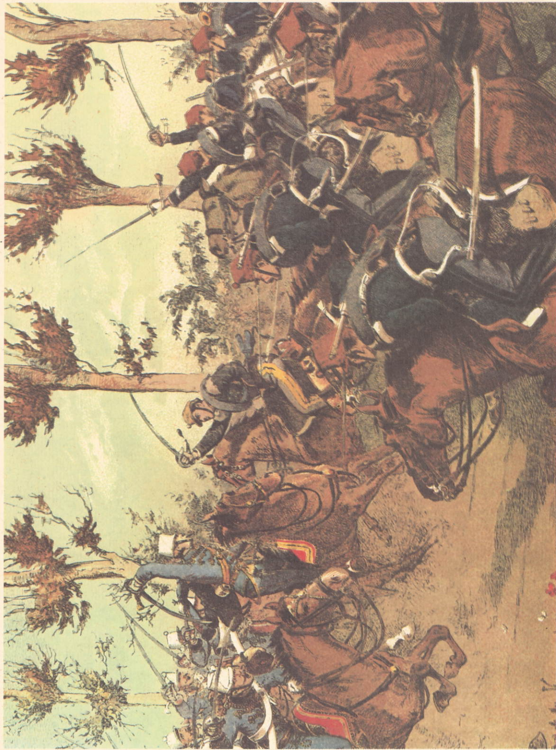
Combattimento di Zinasco - 29 aprile 1859