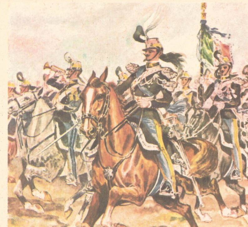
Cartolina reggimentale "Cenni"