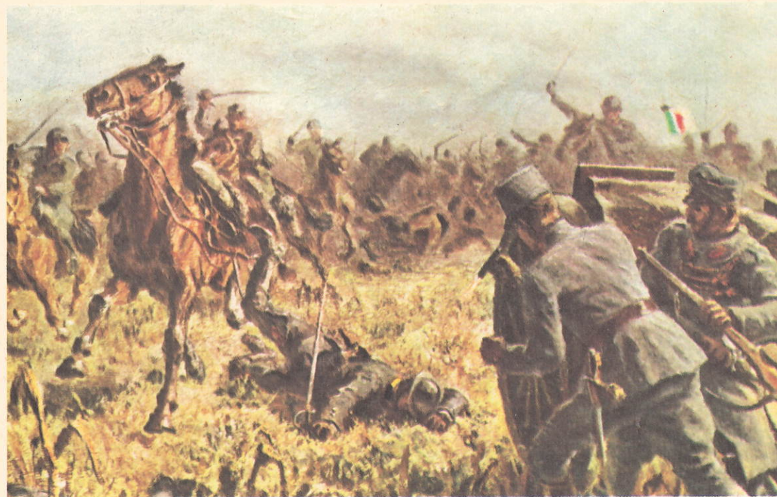
Carica di Tauriano - 2 novembre 1918