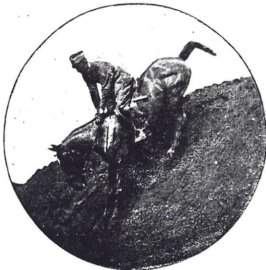
Ten. Col. VALLE

essa maggiore cognizione sui più moderni mezzi di guerra: aviazione, aggressivi chimici, mezzi di trasmissione per i collegamenti.