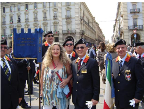
Una fan torinese dei Cavalieri Siciliani

Momenti molto suggestivi e commoventi che hanno stretto in un abbraccio l'Italia tutta, rappresentata dai vessilli della cavalleria italiana lì giunta da ogni parte, così come lusinghiere sono state le manifestazioni di affetto rivolte ai radunisti, come quelle di una cittadina torinese che alla vista della colonnella della Sicilia ha voluto unirsi ai Cavalleggeri di Palermo per farsi ritrarre in una foto ricordo (che riportiamo). ▲