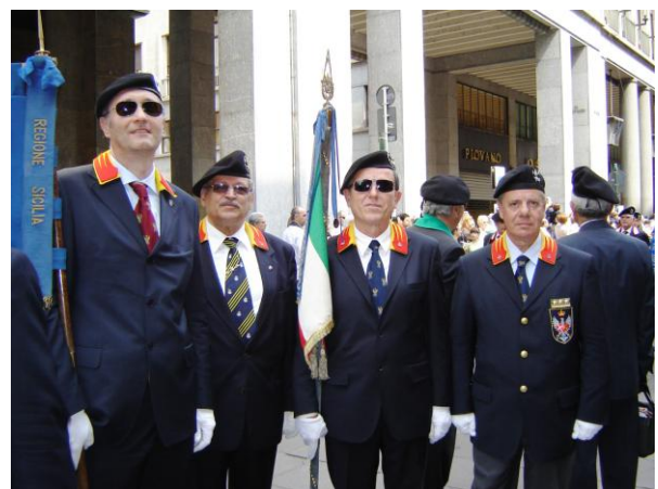
Gruppo stendardo e colonnella della Sicilia

Da quel primo momento, la tre giorni piemontese è stata un caleidoscopio di immagini e bei ricordi, tra i quali la visita del Museo Nazionale del Risorgimento. Quest'ultima mi ha consentito di effettuare un'immersione nella storia dell'unità nazionale, nel corso della quale i valori risorgimentali grazie allo splendido allestimento museale da reminiscenze di studio sono divenuti, reperti, oggetti e documenti storici.