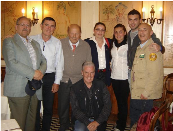
Gruppo di amici a Pinerolo

Qualunque altro commento cadrebbe banalmente nella retorica descrizione e me ne guardo bene. Desidero invece ringraziare pubblicamente tutti gli amici che con tanto amore e fraterno attaccamento ci hanno accolti a Pinerolo accompagnandoci, poi, per la tre giorni torinese.