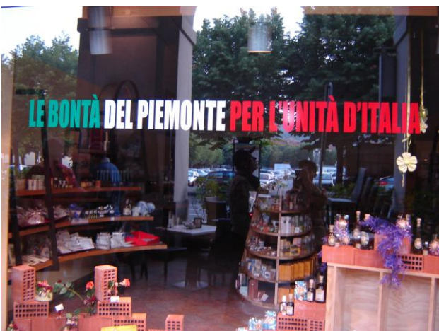
Una vetrina di Pinerolo

Ecco, è questa l'immagine più bella, maggiormente carica di speranza per il futuro della nostra Nazione, quella dell'amore e del rispetto per le Istituzioni. ▲